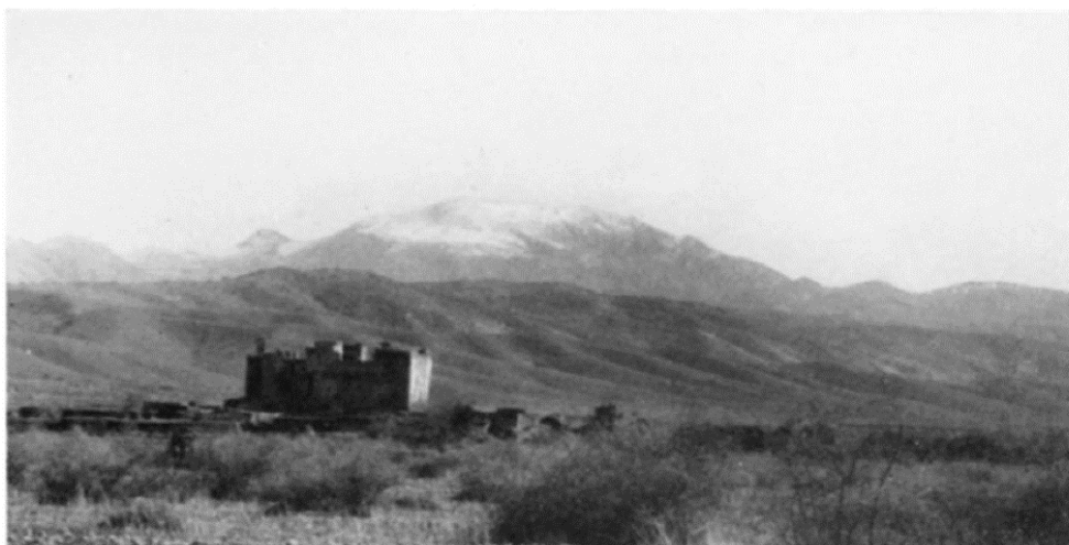
تصویر ۳. نمایی از بافت ۱۹۳۳ م./ ۱۳۱۲ ش.