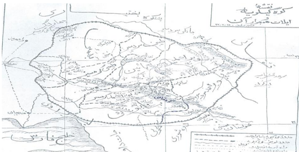
تصویر ۱. موقعیت باشت در کوه گیلویه ۱۳۲۴ش.

تیره‌های متعدد، گروه‌های فراوان و شرایط دیگری که می‌توانست به رشد حیات شهری در این منطقه کمک کند، به علت نبود روابط منسجم بین حاکم و گروه‌های ایلی و تیره‌های مختلف، رقابت‌ها و درگیری‌های ایلی و ساختار ایلیاتی حاکم بر منطقه حیات شهری در این ناحیه شکل مطلوبی نیافت و اساس زندگی اقتصادی بر دامداری و کشاورزی و در حد اندکی تجارت مبتنی بوده است. نکته‌ی قابل توجه دیگر در واژه‌ی باشت و باوی است که اغلب نویسندگان به صورت یک واژه‌ی مستقل به کار می‌برند و برخی عنوان باوی را یک واژه‌ی عربی دانسته و برای ساکنان این منطقه اصالت عربی ذکر کرده‌اند. حال آنکه باشت و باوی دو واژه‌ی مجزا هستند که اولی (باشت) به واحد جغرافیایی و ساکنان بومی منطقه اشاره دارد و دومی (باوی) برگرفته از نام مهاجران واردشده به منطقه است که به دلیل برتری سیاسی و نظامی که در منطقه به دست آوردند، به مرور نام آن‌ها برای منطقه به کار برده شد.